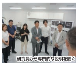
研究者から専門的な説明を聞く