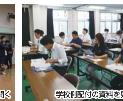
学校側配付の資料を見る