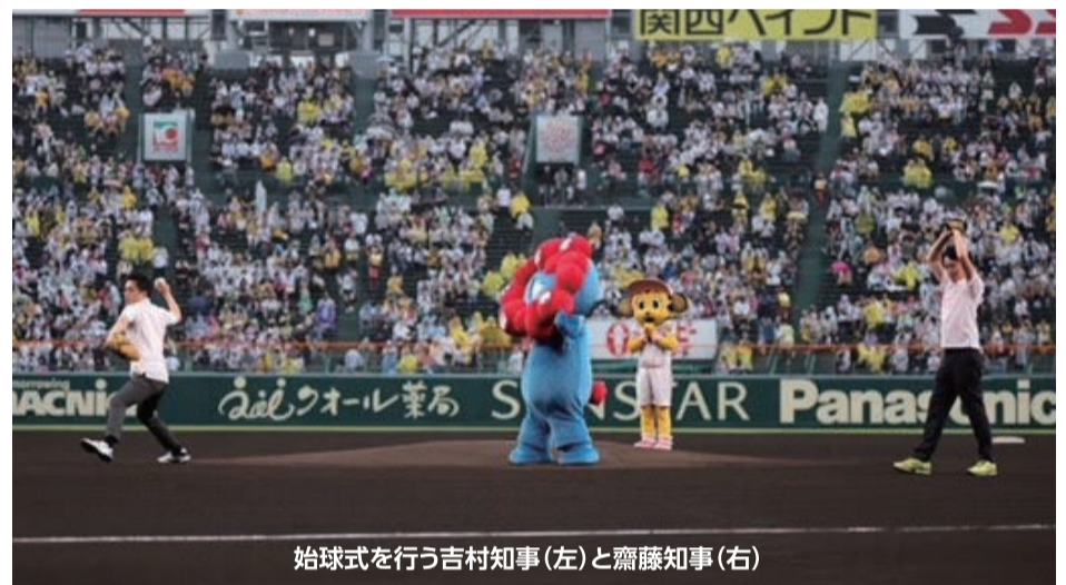
始球式を行う吉村知事(左)と齋藤知事(右)