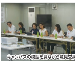
キャンパスの模型を見ながら意見交換