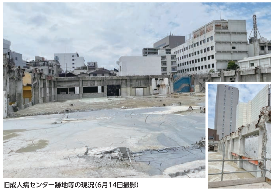
旧成人病センター跡地等の現況(6月14日撮影)

旧成人病センター跡地等は、鉄骨がむき出しで土地にも段差があり、土壌汚染の問題もありました。安全・安心な有効活用について、模索を続ける必要があります。