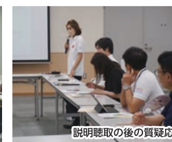
説明聴取の後の質疑応答