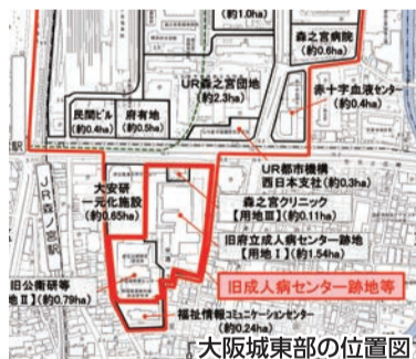
大阪城東部の位置図

健康医療部：森之宮クリニックの土地の更地返還については、解体工事が予定より早く進み10月に終了予定。その後、半年程度の手続き後、返還予定。