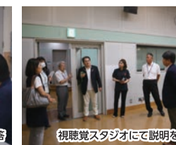
視聴覚スタジオにて説明を聞く